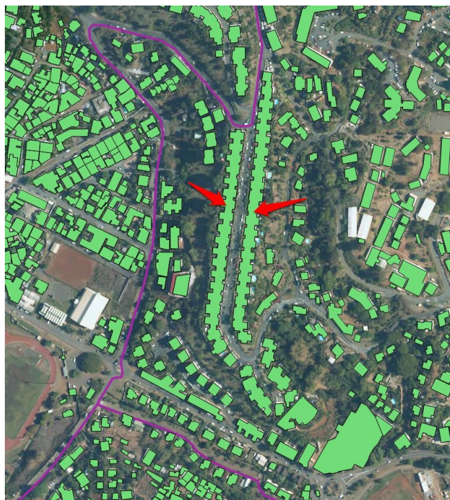
Illustration 1: Mamoudzou : Exemple de bâtiments concentrant une population anormale

L'erreur d'appréciation n'est pas gênante lorsqu'on calcule la population en zone inondable dans toute une commune, elle est plus importante lorsqu'on se concentre sur une zone de calcul beaucoup plus réduite.